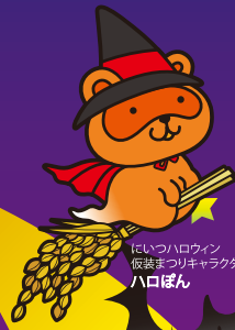
にいつハロウィン 仮装まつりキャラクター ハロぼん